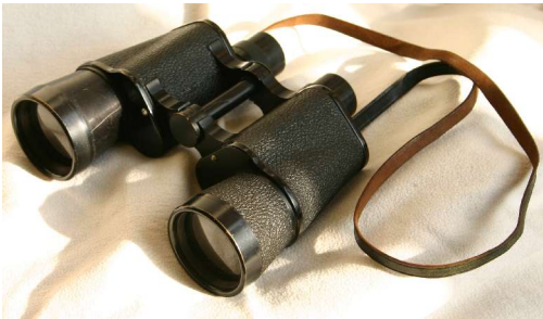
Kijker van N.Baggus.

A •- F ••• K •- P ••• U •• Z ••• B ••• G •- L ••• Q ••- V ••• C ••• H ••• M •- R •• W •• D •• I •• N •- S •• X ••- E • J ••• O •• T •- Y ••- 1 •••• 3 •••• 5 •••• 7 •••• 9 •••• 2 •••• 4 •••• 6 •••• 8 •••• 0 •••• Oproepteken •••- Einde bericht •••- Einde zin of stop ••••- Begrepen •••• Kwijtingsteken ••••-