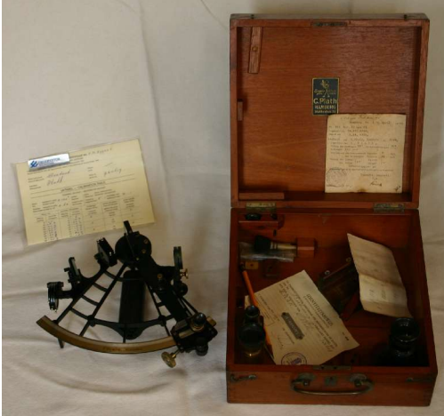
Sextant (C.Plath) van N.Baggus.

Een sextant is een instrument waarmee hoeken worden gemeten. (bijv. tussen de horizon en een hemel lichaam, de zon of een ster, en die samen met een goede tijd meting een positie opleverd.